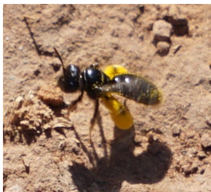
Zottelbiene mit Pollen von Pippau